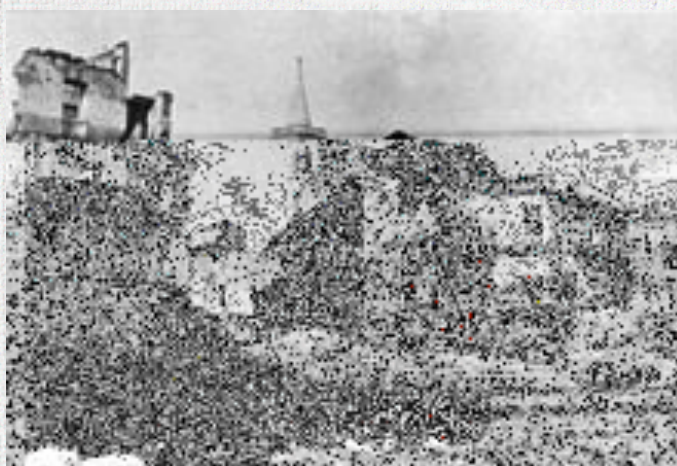
Lijevo: Piazza Marina Desno: Licej Svetog Dimitrija

Prvi veći zračni napad savezničkih snaga na Zadar izveden je navečer 2. novembra/studenog 1943. godine, kada je među ostalim objektima razoren dom za nezbrinutu djecu, a slijedili su veliki napadi 28. novembra/studenog (preko 200 žrtava) te 16. i 30. decembra/prosinca iste godine. Prve je napade obilježio veliki broj civilnih žrtava, ali je grad, iako oštećen, još uvijek funkcionirao. Naročito je teško bilo bombardiranje 16. decembra/prosinca, kada su pogođena skloništa na Cereriji (današnja Voštanica) i u samom centru grada. Pritom je poginulo oko 150-200 ljudi. U udaru je sudjelovalo 50 američkih bombardera "Mitchell" (B-25) koji su bacili 90 tona bombi.